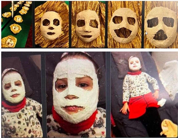
2011 - "Wir bauen ein Haus" im FEZ Berlin