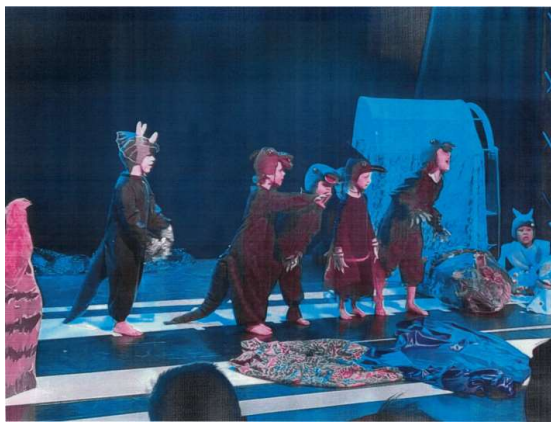
2020 - Generalprobe vor dem FEZ Auftritt